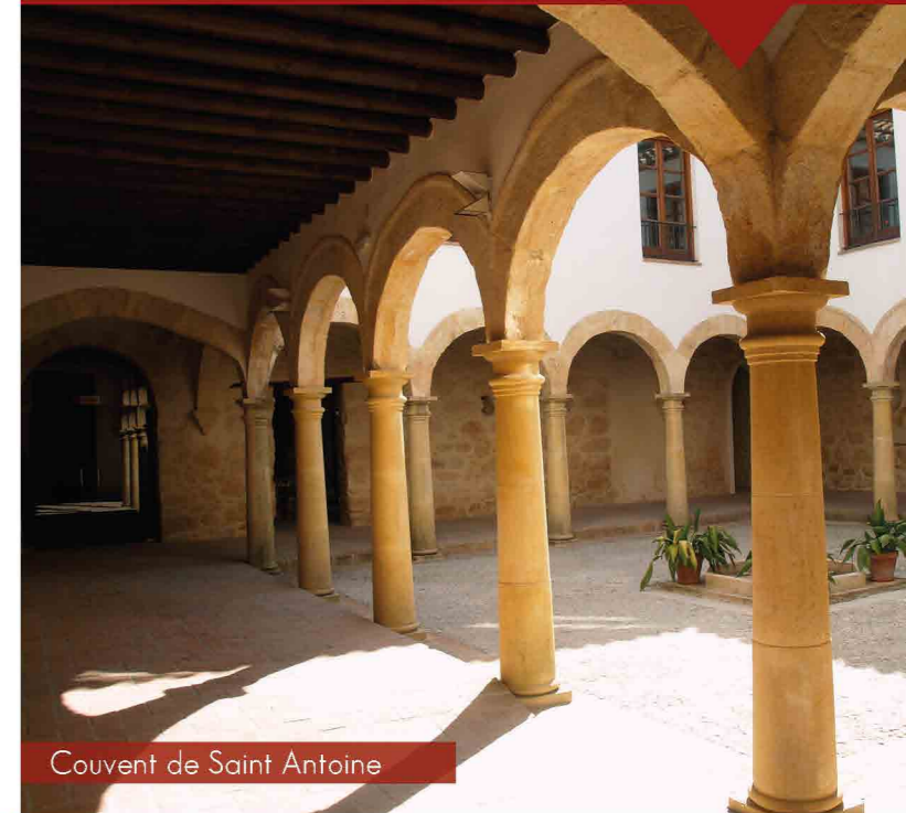
Couvent de Saint Antoine